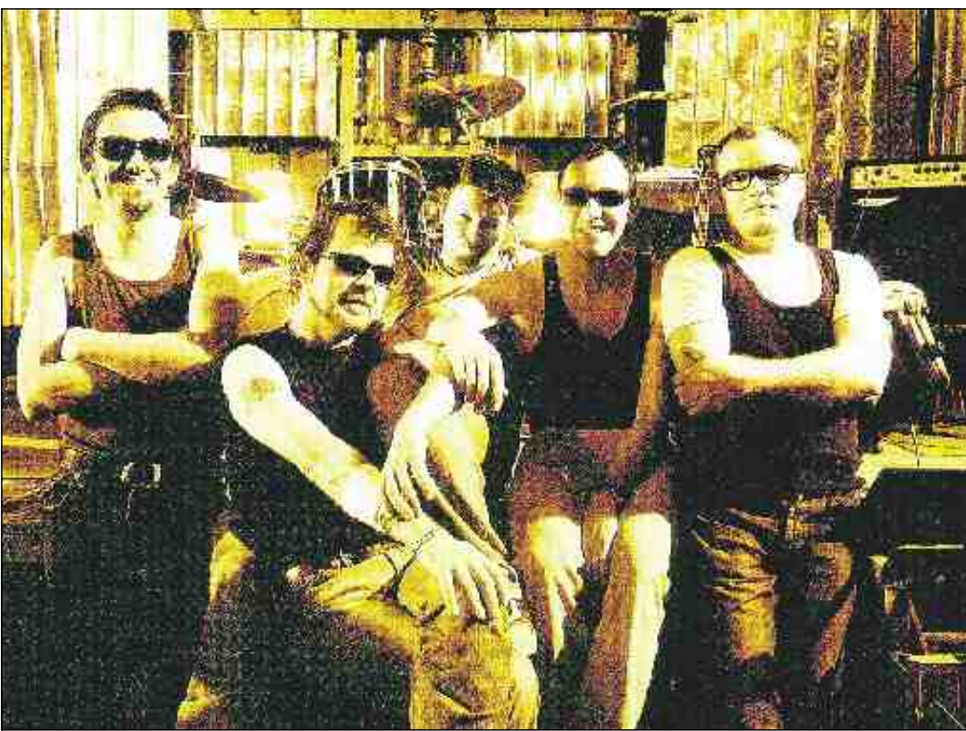
Mi2 – V živo na Rožniku.